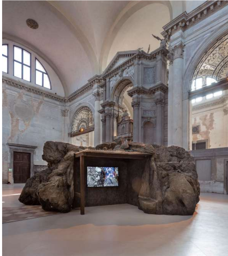
Ocean Space 「The Soul Expanding Ocean #4: Diana Policarpo. Ciguatera」展覽現場。

本次專題中特別介紹的蓋爾迪納雙年展 (Biennale Gherdëina)，亦是在探討自然體的人格 (persona) 的同時，強調人類、動物、植物與物質之間的互動關係，並藉由各式的表演、山