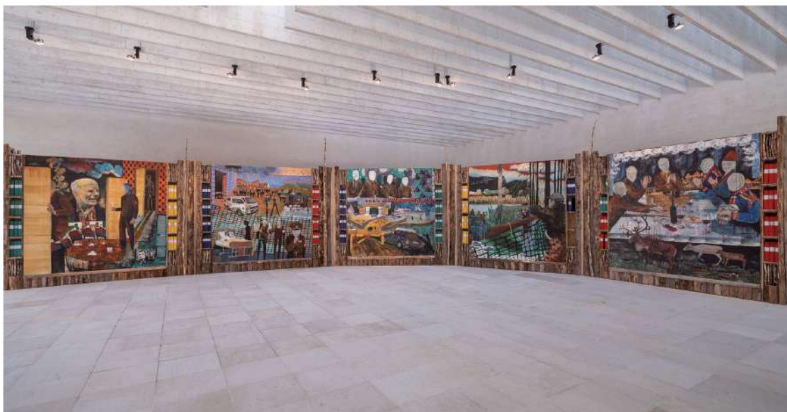
2022 威尼斯雙年展薩米館展覽現場。