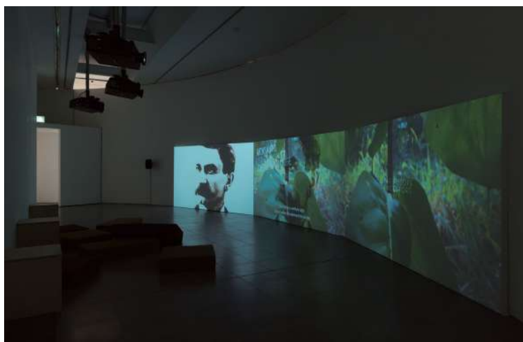
蛇形畫廊「Back to Earth」展覽現場，圖為Karrabing Film Collective作品《The Family(A Zombie Movie)》(2021)。

在深層時間中，人類的腳步走得看似極速卻也極緩，我們隔著螢幕看著遠方戰火隆隆，聽著冰川墜落，而跟著一起前進的，飛也似的科技、災難或許並非等待在線性的另一端，正如火與冰也從不分屬兩個世界。先不管剛剛談到的女性主義環境人文這門新學科了，我們最急需的知識裝備或許是先學習忘卻，在面對氣候危機升起的道德與慾望的困局，在人類世的孤掌難鳴下，以多於人 (more than human) 的世界觀，讓我們的人格越界，與萬物建立起親緣。或許，會發現我們早就帶著危機的解方一路行走，並一起生活。